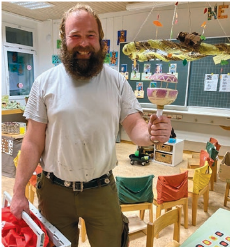
Das Rábenschnitzen der Väter stiess eindeutig auf Begeisterung