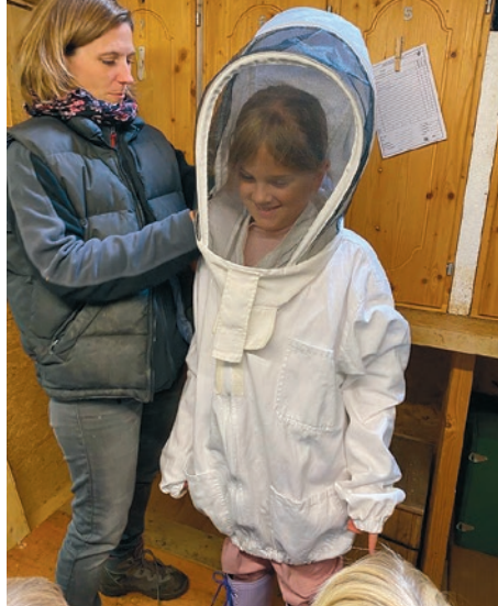
Einmal Imker/in sein