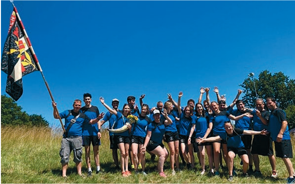
Die Aktiven des Turnverein Uesslingen am Turnfest Seerücken

Der Turnverein Uesslingen blickt zurück auf eine erfolgreiche, gesellige und von Sonne beschenkte Wettkampf-Saison!