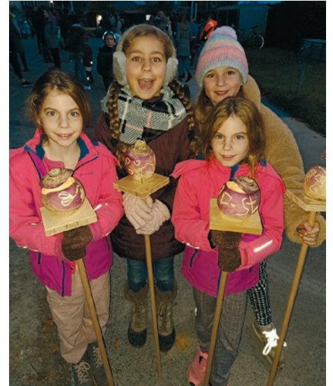
Stolze Schülerinnen mit ihren selbstgeschnitzten Räben