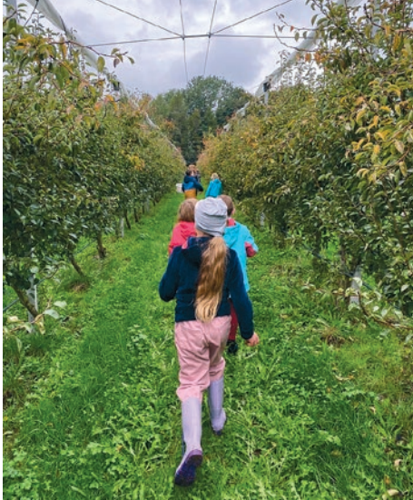
Ein Marsch durch die Reben