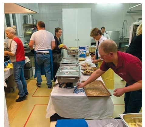
Blick in dem Office, wie im Hintergrund gearbeitet wurde