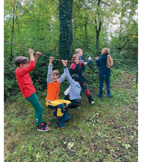
Ein bisschen Spass muss auch mal sein