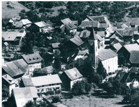
Der Dorfkern Üsslingens nach 1938 (neuer Kirchturm). Am linken Rand ist das ehemalige Feuerspritzenhaus ersichtlich.