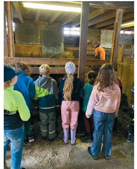
Auch ein Blick in den Stall muss sein

Wir setzen auf die Zukunft. Zurzeit absolvieren sechs Lernende eine handwerkliche, anspruchsvolle und lehrreiche Ausbildung als Schreiner/in EFZ in unserem Betrieb.