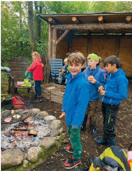
Auch eine Mittagspause muss drin sein