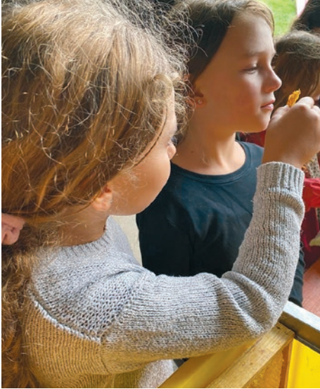
Wir durften randvoll gefüllte Waben

Im Spätsommer durften die Kinder der 3. und 4. Klassen einen Tag auf dem Bauernhof verbringen. Bereits am frühen Morgen wurden sie vom Schulbus nach Thundorf gefahren, genauer gesagt auf den Pfeien-Hof der Familie Früh.