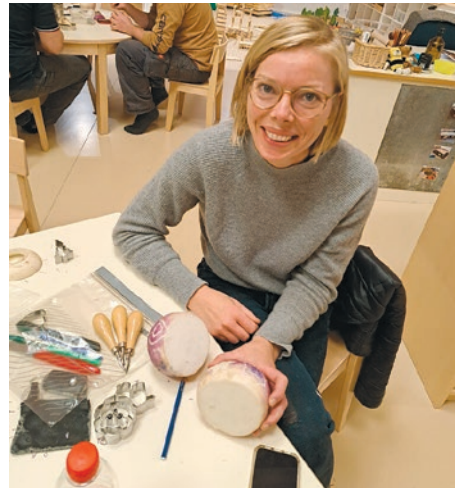
Gleich zwei Rábens schnitzte diese Mutter für ihre zwei Jungs