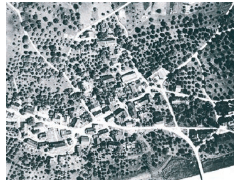
Erste Flugaufnahme des Dorfes zirka 1928. Wo sind nur diese Bäume geblieben?

Nachdem sich die Geräte der Feuerwehr längere Zeit auf der Diele des katholischen Schulhauses (heute Haus Ott) befanden, befasste man sich im Jahre 1844 mit dem Bau eines Spritzenhauses. Nach dem Kauf eines Grundstückes wurde sofort mit den notwendigen Arbeiten begonnen. Das Spritzenhaus befand sich etwas unterhalb der heutigen Telefonzentrale und wurde An-