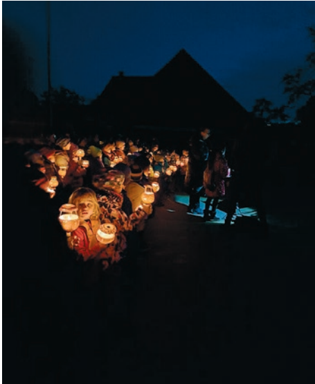
Gemeinsames Singen der Kindergarten- und Schulkinder