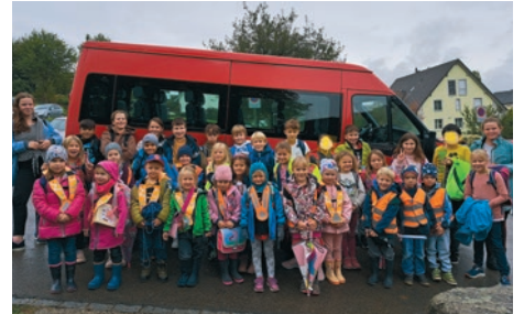
Alle Schulbuskinder mit dem <alten> Schulbus, der nun ausgetauscht wurde

Wir wünschen allseits sichere Fahrt – beiden unserer Schulbusse selbstverständlich. Und danken an dieser Stelle all unse-