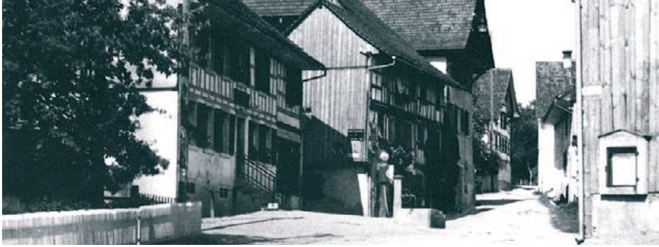
Die Oberdorfstrasse Richtung Warth. Heute stilvoll renovierte Riegelhäuser aus dem 18. Jahrhundert.

An der Spitze stand der Kommandant und sein Stellvertreter. Daneben gab es Wendrohrführer, Schlauchhalter, Trucker, Flöchner, Windlichtträger, Männer mit «Tausen», Männer mit «Schöpfer», Männer mit Leitern und «Haggen» und die Feuerwache. Nicht zu vergessen sind die Feuerläufer, welche die Nachricht vom Feuer in die Nachbargemeinden bringen mussten, um zusätzliche Hilfe anzufordern. Als Feuerläufer wurden 1866 bestimmt: