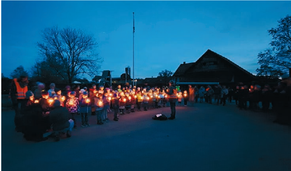
Vor dem ehemaligen Schulhaus in Buch war Start und Ende des Umzugs