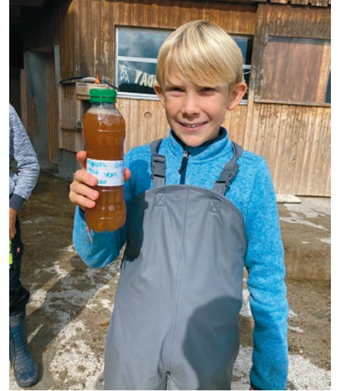
Frisch gepresster Most