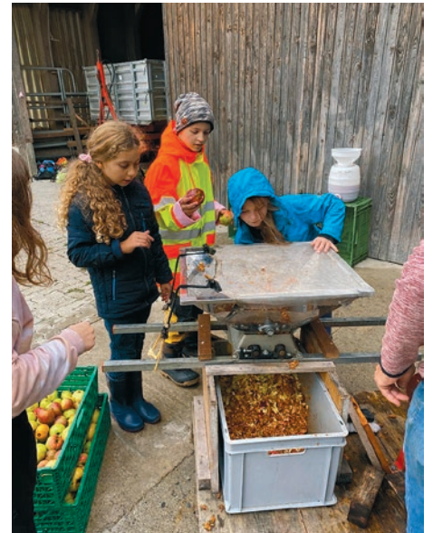
Bevor es frisch gepressten Apfelmost gibt, muss erst einmal gearbeitet werden