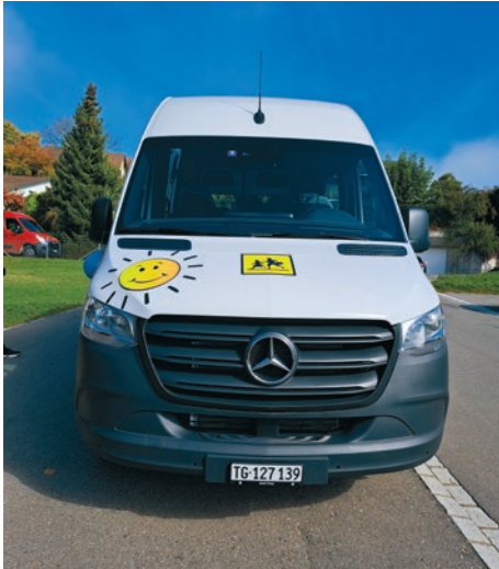
Der neue Schulbus der Primarschule Uesslingen-Buch

Bereits in der Pause hofften die Schüler und Schülerinnen unserer Primarschule, dass sie endlich den neuen Schulbus sehen würden. Voller Vorfreude rannten sie auf den Pausenhof und wurden... leider enttäuscht. Jedoch nur fürs Erste.