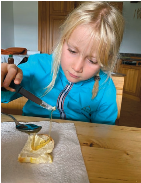
Honig direkt ab Hof schmeckt so viel besser