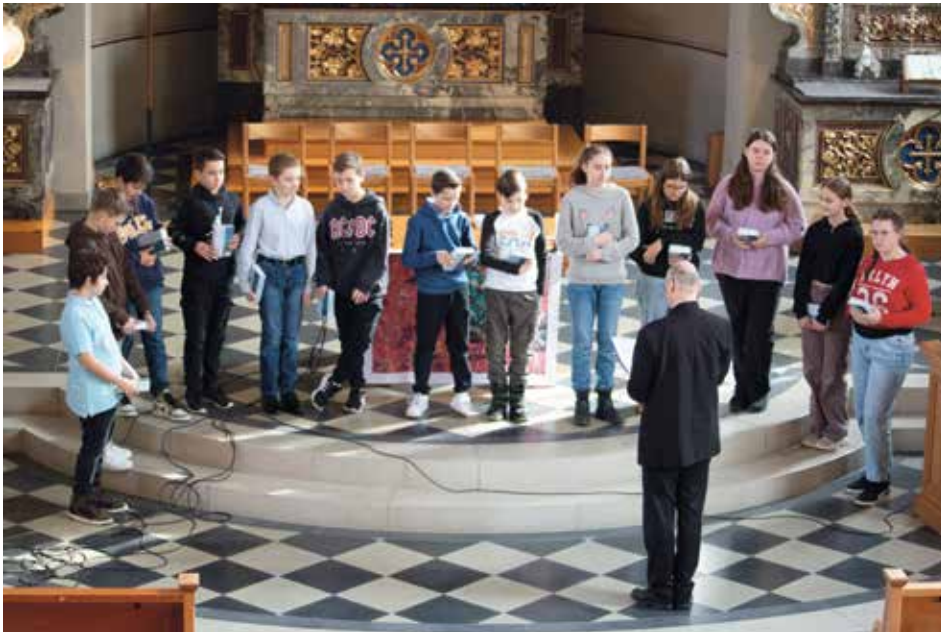
Die ReligionsschülerInnen bei der Bibelübergabe