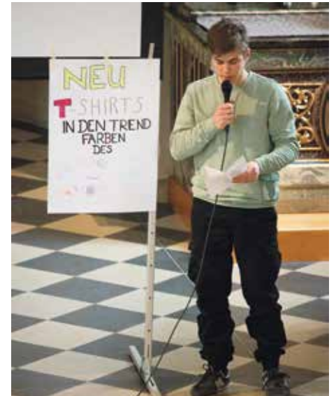
Konfirmand beim Anspiel