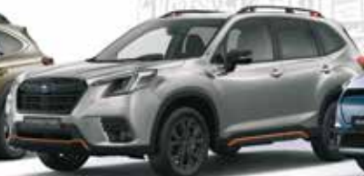
Forester: 4x4 Hybrid