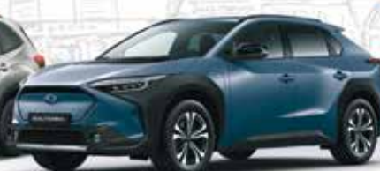
Solterra: 4x4 100% elektrisch