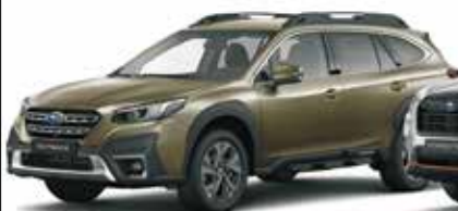
Outback: 4x4 mit Boxermotor