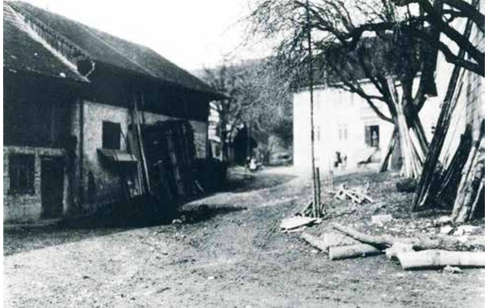
Eine Aufnahme, welche in einem Prozess des J. Lenz zum Engel anno 1895 ein Beweisstück war. Im Hintergrund der «Engel», erbaut 1844 von Dr. Villiger.

Die Linienführung folgte oft nicht einer vernünftigen Leitlinie, sondern nahm Rücksicht auf die Besitzverhältnisse. Der Weg hielt bald nach links, bald nach rechts, wie alte Karten belegen. Eine übergeordnete Planung fehlte völlig, eine Zusammenarbeit zwischen den Nachbargemeinden weitgehend. Wo der Morast auf den Strassen zuboden los wurde, versuchte man mit Ästen, Reisig oder Steinen notdürftig die Situation kurzfristig auf möglichst kostengünstige Weise etwas zu verbessern. Anfang des 19. Jahrhunderts ging die Pflicht zur Anlage und zum Unterhalt der wichtigsten Strassen an den Staat über, und es wurde ein Strassenreglement geschaffen. Bis 1833 entstanden die wichtigsten Hauptverbindungen.