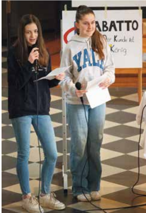
Konfirmandinnen beim Anspiel