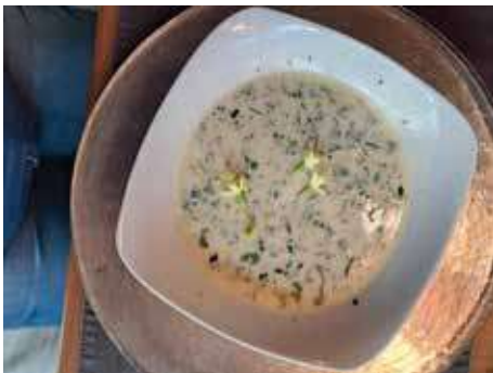
Das köstliche Endresultat