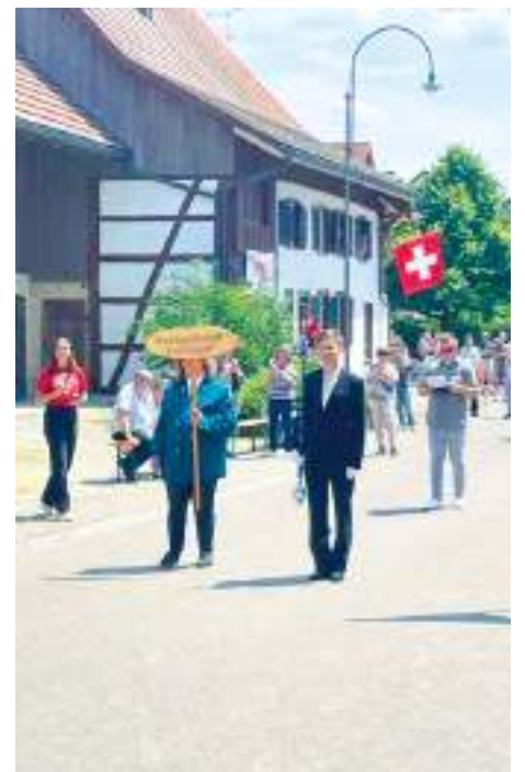
Am Weinländer Musiktag