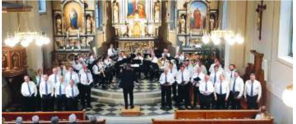
Muttertags Konzert in der Kirche Uesslingen

Am Samstag, 13. Mai, führten wir zusammen mit dem Männerchor Buch unser alljährliches Muttertags Konzert in der Kirche Uesslingen durch. Die Bänke waren gut besetzt und dem Publikum gefielen die Darbietungen sehr. Alles in allem war es ein schönes und stimmiges Konzert. Danach konnten die Konzertbesucher bei einem Apéro, der von der PG Uesslingen-Buch offeriert wurde, den Abend ausklingen lassen.