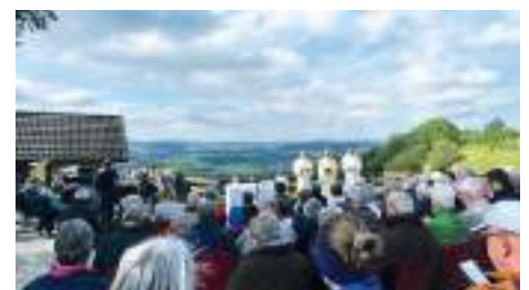
Gottesdienst im Iselisberg

Zu Christi Himmelfahrt fand beim Kreuz im Iselisberg ein Gottesdienst unter freiem Himmel statt.