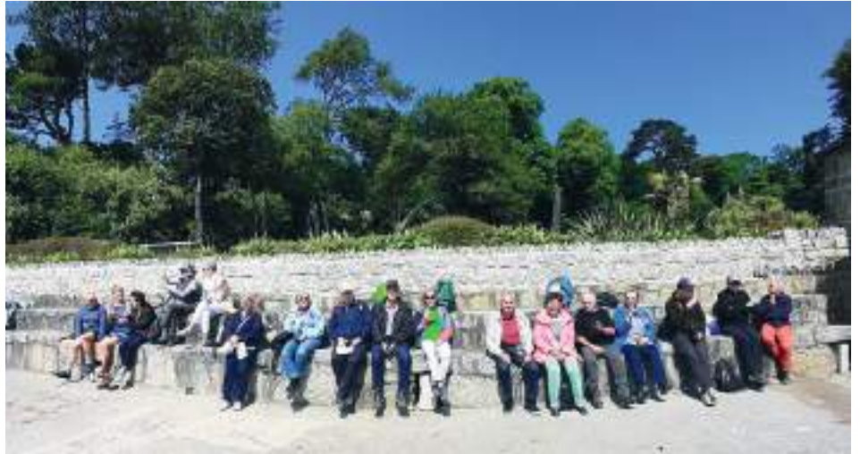
Gruppenbild bei Trebah Garden

Nicht fehlen durfte auch die Natur. Wir besuchten den Trebah Garden, der mit seinen Farnbäumen und den riesigen Rhabarbern beeindruckte.