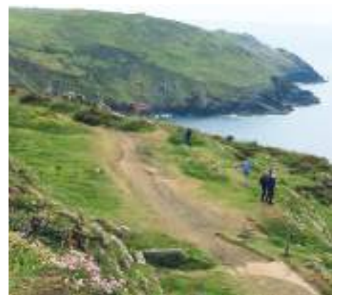
Wanderung zur Botallack Mine