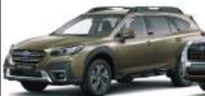
Outback: 4x4 mit Boxermotor