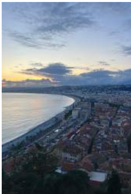
Blick aus dem Schloss in Nizza

Anton Kolic Lernender Gemeindeverwaltung