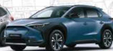
Solterra: 4x4 100% elektrisch