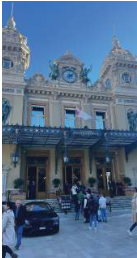
Der Eingangsbereich vom Casino in Monaco