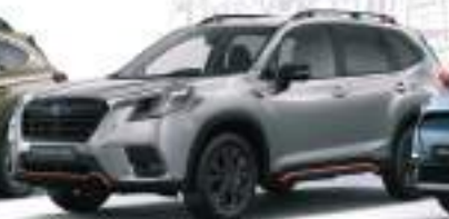
Forester: 4x4 Hybrid