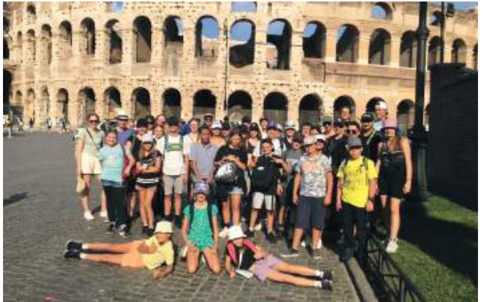
Gemeinsam unterwegs waren unsere Minis auch in Rom.