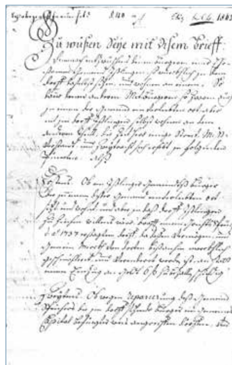
Die Bürger und Ansassen legen in diesem Dokument unter verschiedenen Punkten ihre Rechte fest.